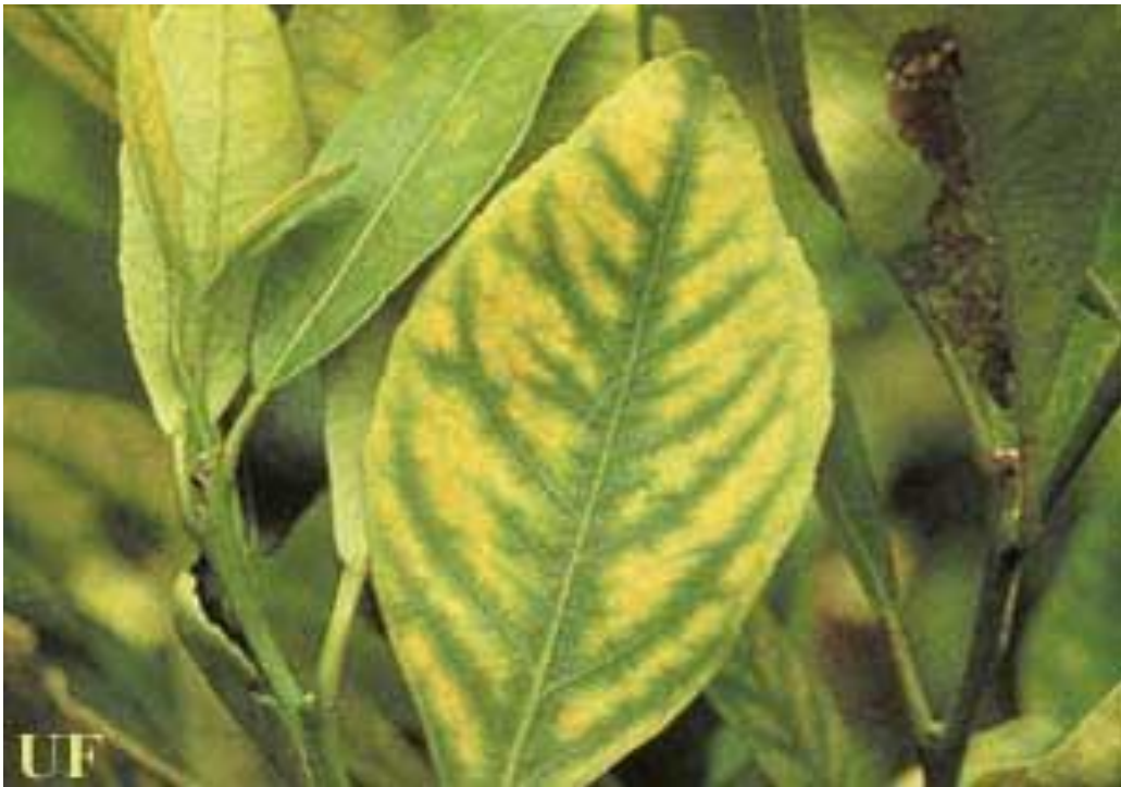
Anexo 2. Afectación en Hojas.