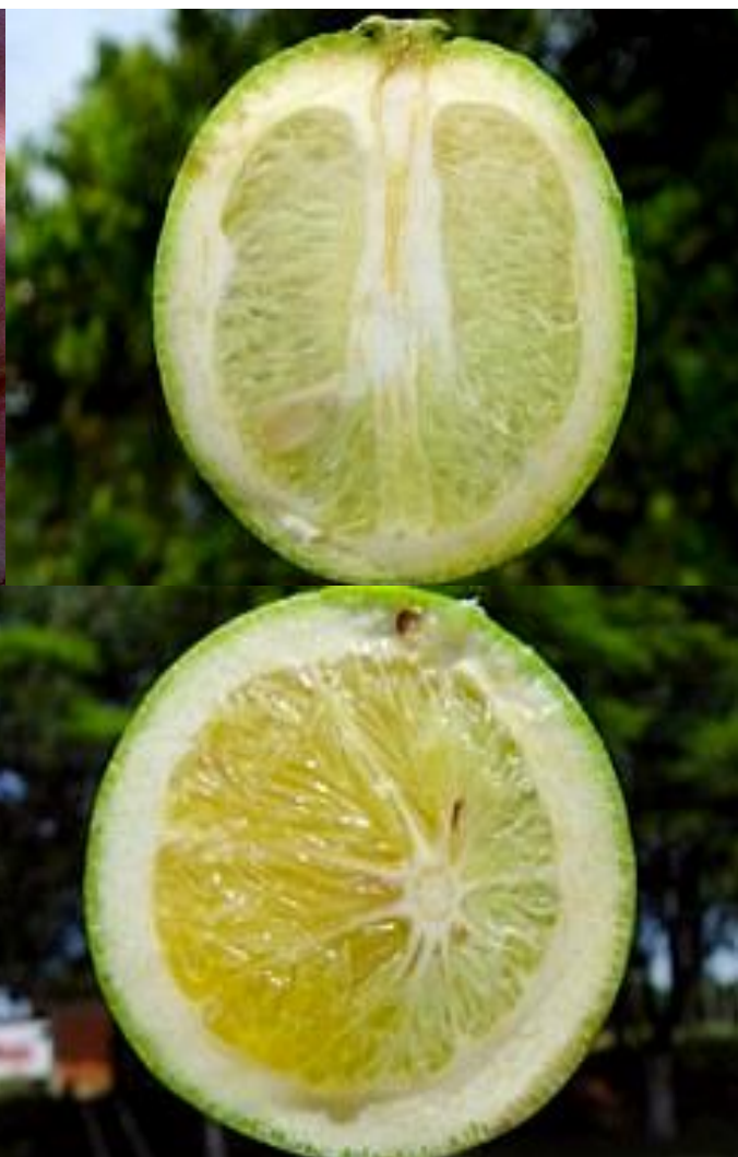
Anexo 3. Afectación en Frutos.