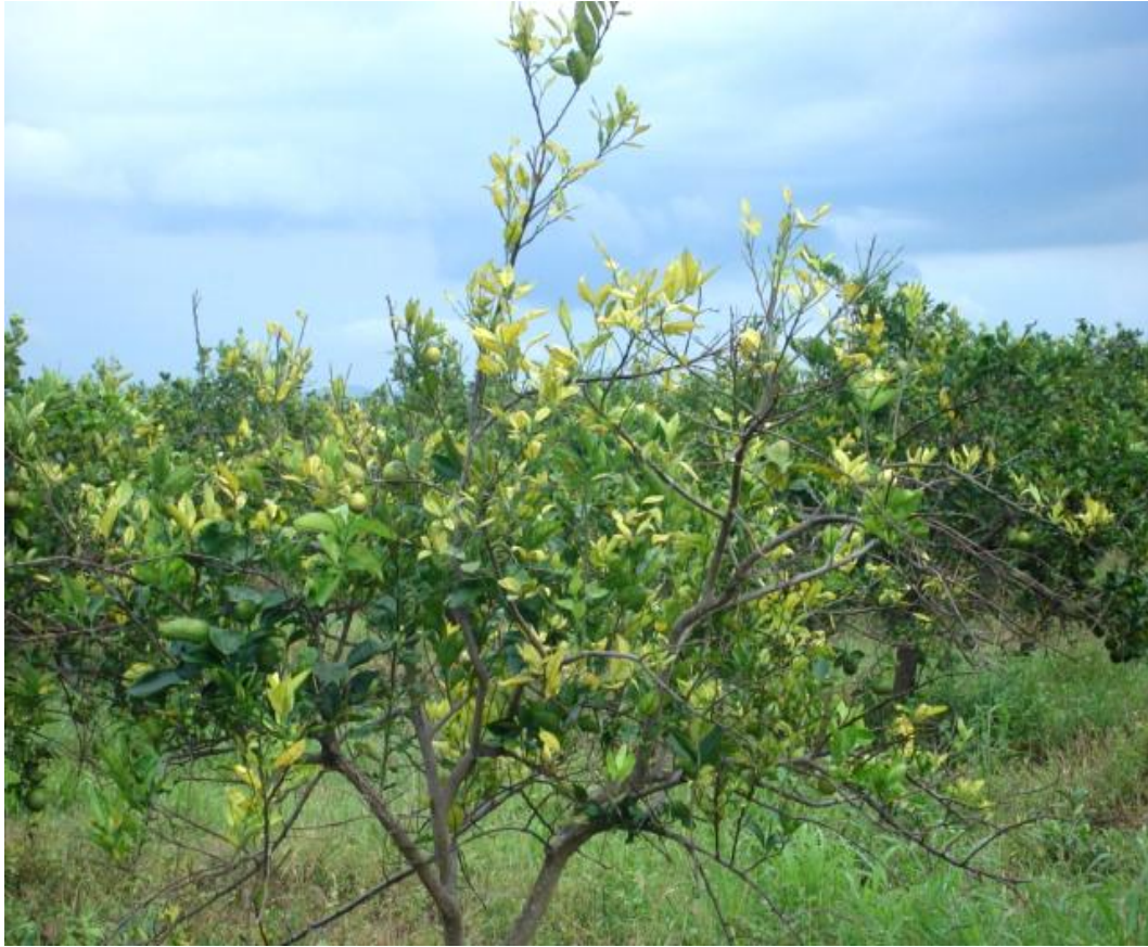
Anexo 3. Afectación en Plantación