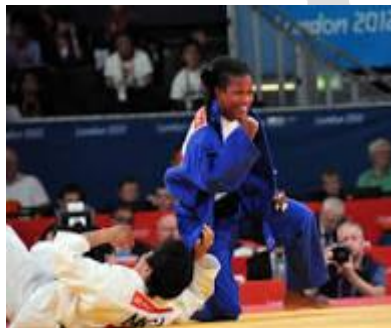
Fig. 10. Judocas cienfuegueras.