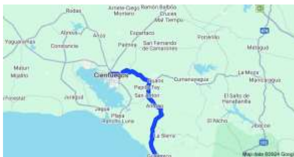
Figura 1 Localización del área de estudio en el circuito sur de Cumanayagua.

En resumen, el circuito sur de Cumanayagua en Cienfuegos, es una región con características geográficas montañosas, una población rural con una fuerte tradición agrícola, una economía basada en la agricultura, una producción agrícola diversa y desafíos ambientales que requieren atención y cuidado.