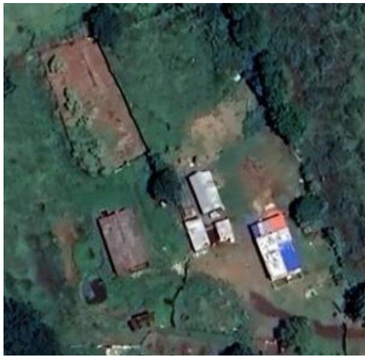
Figura 1. Mapa Finca Futuro.

La investigación se llevó a cabo en La finca Futuro, Demarcación Cieneguitas, Abreus, Cienfuegos, Cuba, con las siguientes coordenadas geográficas: desde Latitud 22^{\circ} 27' 42'' Norte y longitud 80^{\circ} 61' 68'' Oeste hasta Latitud 22^{\circ} 27' 65'' Norte y longitud 80^{\circ} 61' 75'' Oeste.