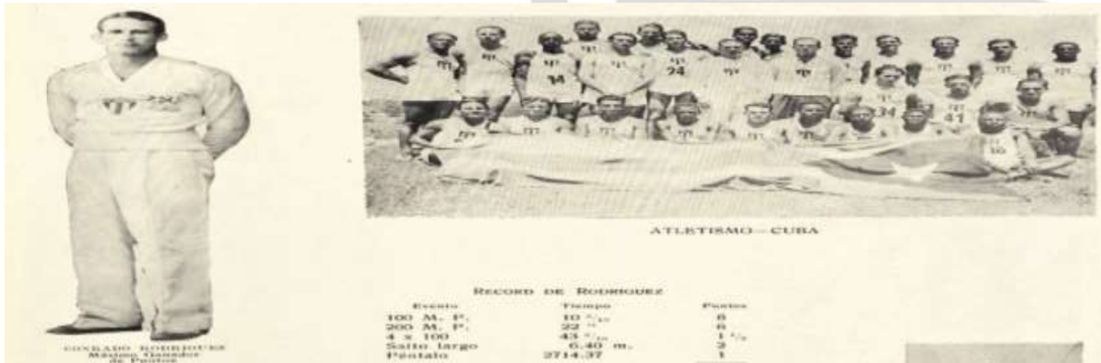
Fig.2. Elaboración Propia.

El atletismo cubano en los Juegos Centroamericanos de San Salvador 1935.