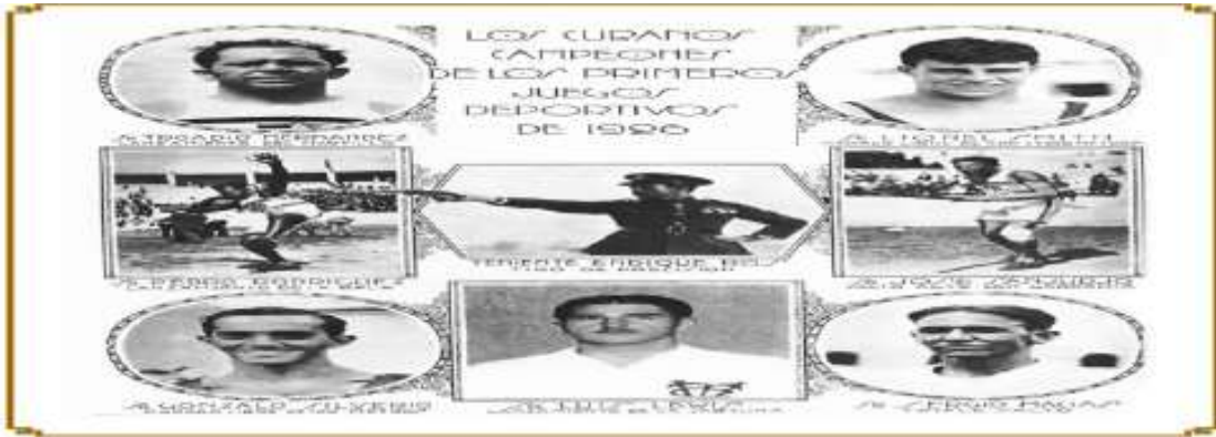
Fig.1. Elaboración Propia.

Anexo-1. Campeones cubanos Centroamericanos de 1926.