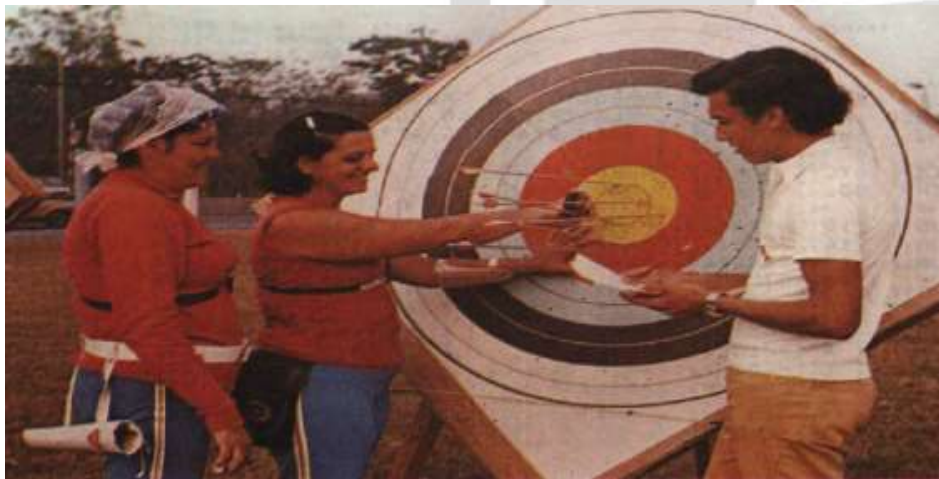
Fig. 6. Elaboración Propia.

Equipo femenino cubano de Tiro con Arco. Campeón Centroamericano y del Caribe.