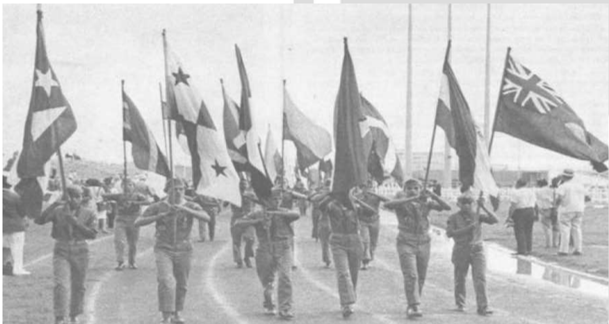
Fig. 5. Elaboración Propia.