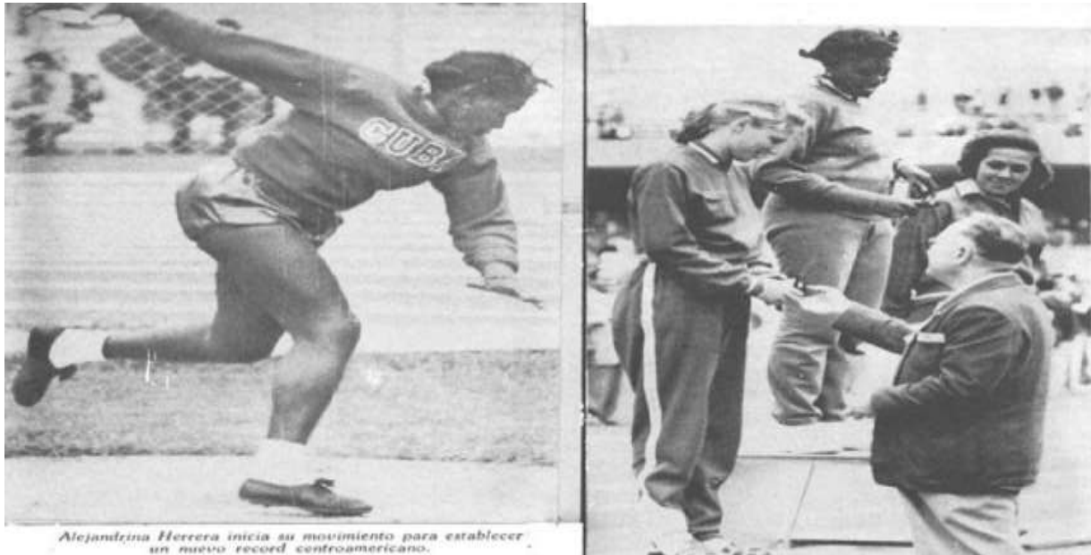
Fig. 3. Elaboración propia.