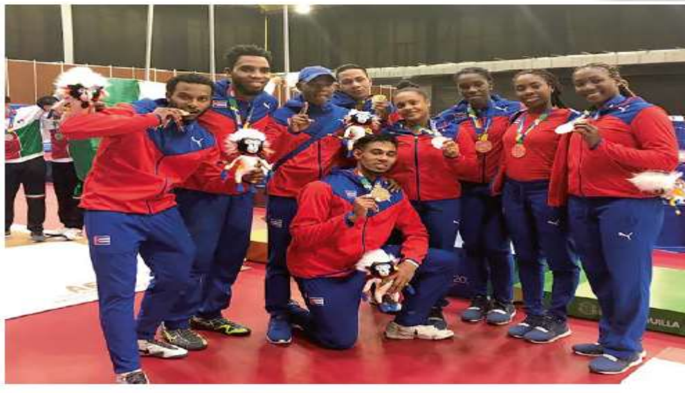
Fig. 8. Elaboración Propia.

Anexo- 7. Equipo de esgrima Campeón en Barraquilla 2018.