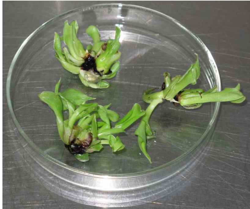
Figura 4. Multiplicación in vitro del cultivar 'INIVIT PV 06-30' en el medio de cultivo P5.

La 6-Benzilaminopurina (6-BAP) es en general la citoquinina más efectiva en la inducción de yemas axilares. No obstante el papel determinante de las citoquininas en esta fase en algunos casos es necesaria la adición de auxinas para estimular el crecimiento de los brotes. (Hu y Wang, 1983) Uno de los posibles efectos de las auxinas en la Fase II es anular el efecto depresivo de las altas concentraciones de citoquininas sobre la elongación de los brotes axilares y restablecer el crecimiento normal de los mismos.