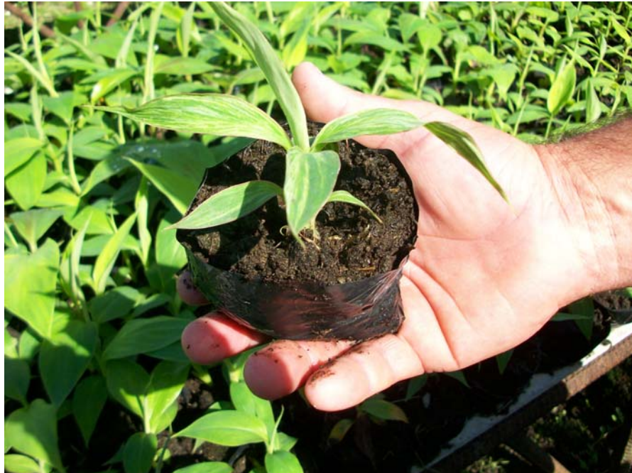
Figura 4. Variante somaclonal observada durante la fase de aclimatización del cultivar 'INIVIT PV 06-30'.

Côte et al. (2000), durante la fase de aclimatización de plantas regeneradas de embriones somáticos en el cv. 'Gran Enano' (AAA), observaron hojas variegadas, que ocuparon del 0,5-1,3% de la población y señalaron además, que cuando estas plantas fueron llevadas a campo, desapareció este cambio morfológico, quizás debido a cambios epigenéticos ocurridos.