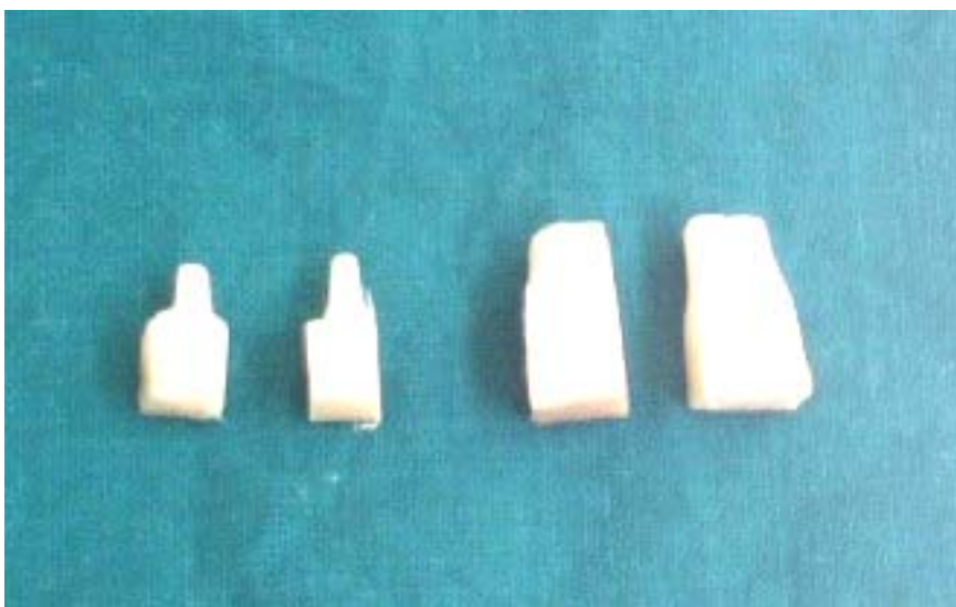
Figura 1. Explante utilizado para el establecimiento in vitro del cultivar 'INIVIT PV 06-30'. Izquierda Control Biofábrica y derecha nuevo explante.

Al estudiar el nuevo explante utilizado (basado en su modo de preparación) (Figura 1) para el establecimiento in vitro , se pudo apreciar que referente a la presencia de contaminantes del explante en ambos casos, solo se presentó un 5%. Luego al evaluar algunos indicadores de su desarrollo (Tabla 5) como la coloración verde, la misma se produjo a los cuatro días en el nuevo explante con diferencias significativas del explante utilizado tradicionalmente. De forma similar también se comportó con diferencias significativas la presencia de la primera hoja abierta a los 6,36 días en el nuevo explante utilizado y a los 13,8 días en el control de la Biofábrica.